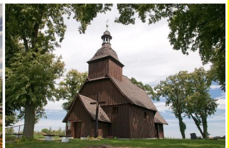
Hyazinthkirche Omechau