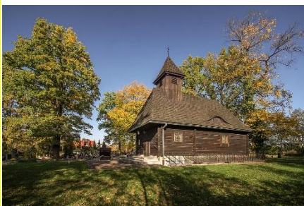
Friedhofskapelle Ober-Ellguth