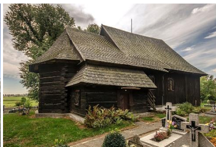
Christkönigskirche Matzdorf Kreis Kreuzburg