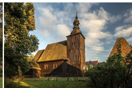
Peter-Paul-Kirche in Rosen