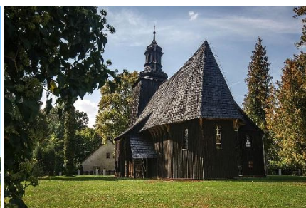
Herz-Jesu-Kirche in Proschlitz