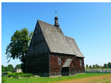
Laurentiuskirche in Nassadel