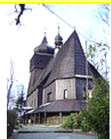
Allerheiligenkirche in Lazisk / Kreis Loslau