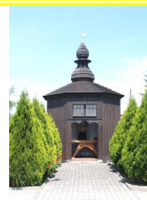
Hl. Nepomuk in Lubom / Kreis Loslau