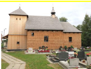
Mariä Geburt in Schalscha / Kreis Tarnowitz