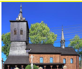
St Anna in Golkowitz / Kreis Loslau