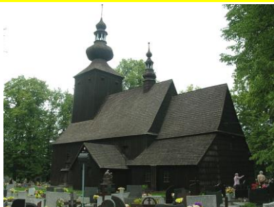
St. Martin in Cwiklitz / Kreis Pleß