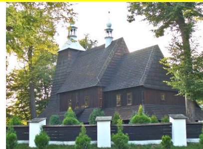
Hl. Johannes der Täufer in Grzawa / Kreis Pleß