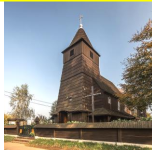
St.Barbara in Guhrau / Kreis Pleß