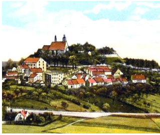
St. Annaberg Oberschlesien