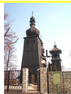
Glockenturm St. Josef in Sadow / Kreis Lublinitz