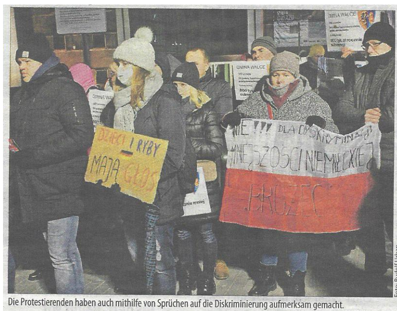
Die Protestierenden haben auch mithilfe von Sprüchen auf die Diskriminierung aufmerksam gemacht.