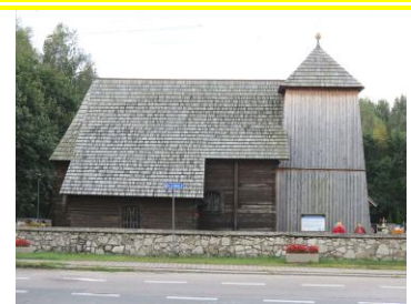
Erzengel-Michael-Kirche in Rudzinitz / Kr. Gleiwitz