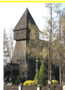
Nikolaikirche in Wilcza / Kr. Gleiwitz