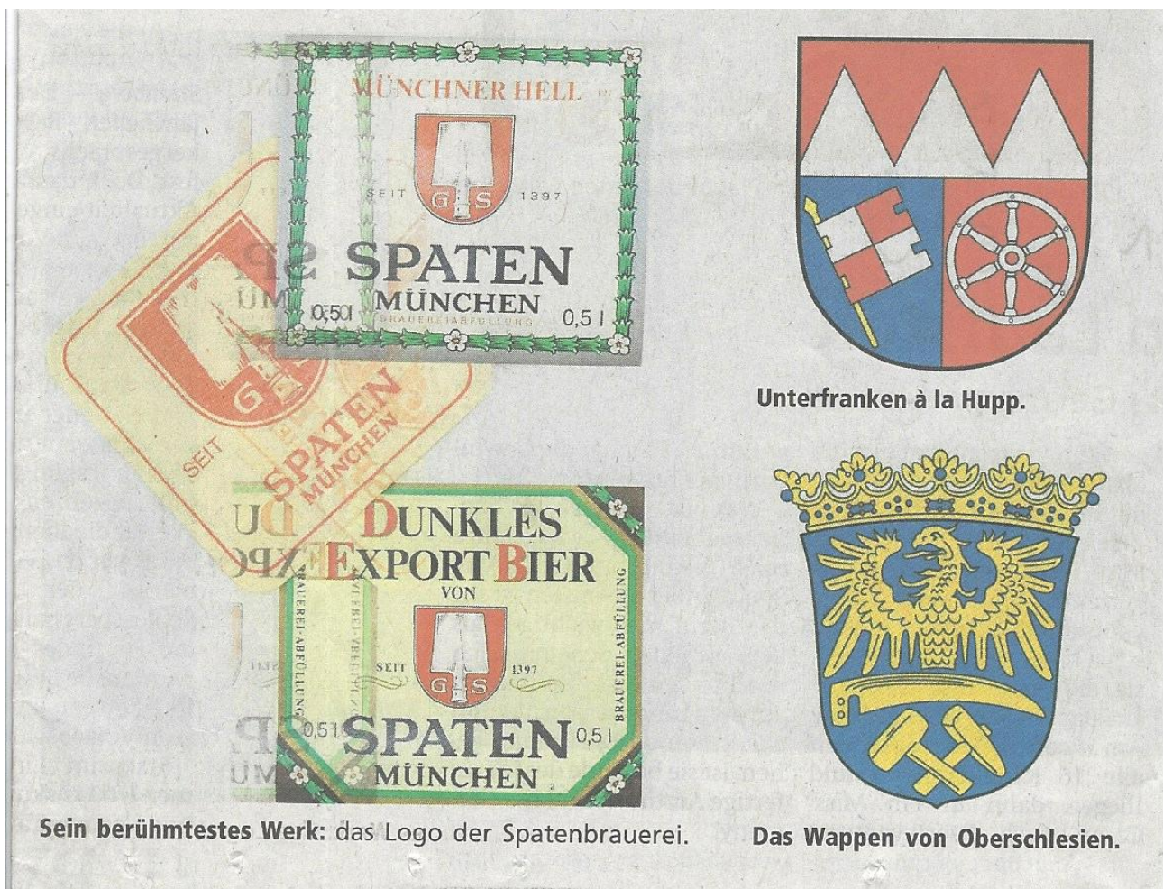
Sein berühmtestes Werk: das Logo der Spatenbrauerei.