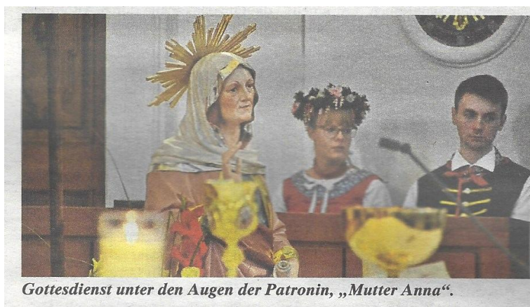
Gottesdienst unter den Augen der Patronin, „Mutter Anna“.

Quelle: Altöttinger Liebfrauenbote, Text und Fotos: Roswitha Dorfner