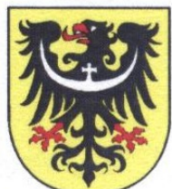
LM Schlesien Nieder- u. Oberschlesien

Halten wir unsere schlesische Kultur und Tradition hier in Westdeutschland und in der Heimat wach!