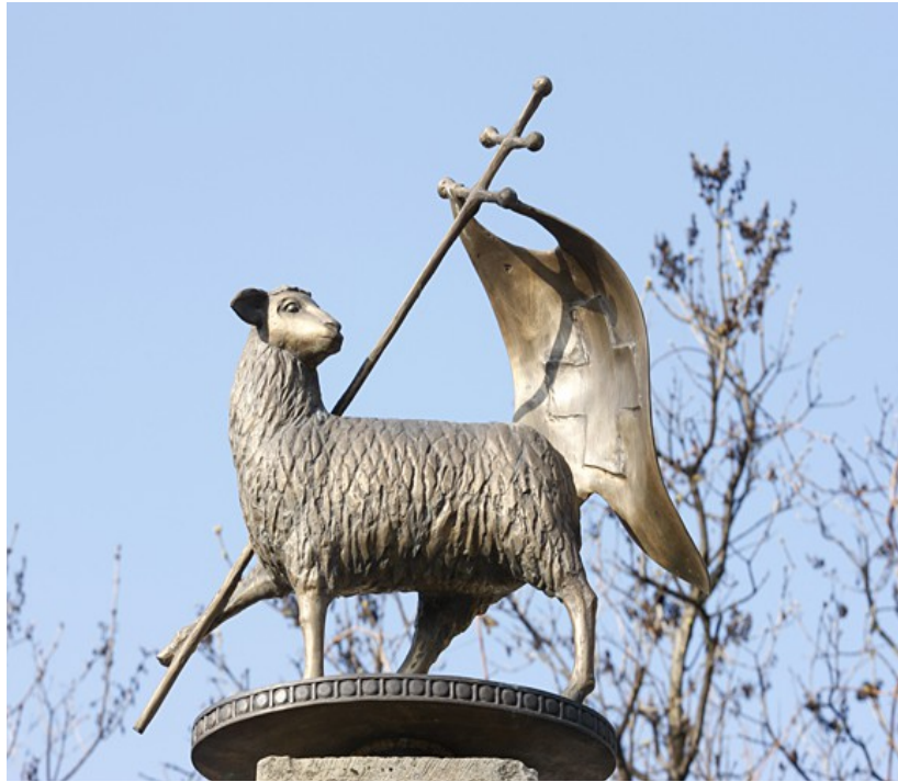
Statue aus Szentendre/Ungarn

Das (Oster)Lamm, gekennzeichnet mit einer Siegesfahne, ist ein Symbol für die Auferstehung Jesu